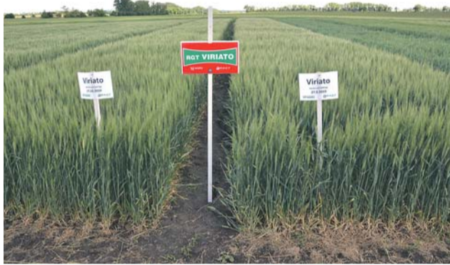
Rozdíly v porostu odrůdy Viriato setých v různých termínech

„Hlavním cílem tohoto polního dne je seznámit i v této těžké době, kdy tady nemohou být všichni najednou s tím, co je nového na trhu. Dát důraz na další informace o stávajících odrůdách tak, aby si zemědělec mohl zvolit správnou odrůdu a nemusel