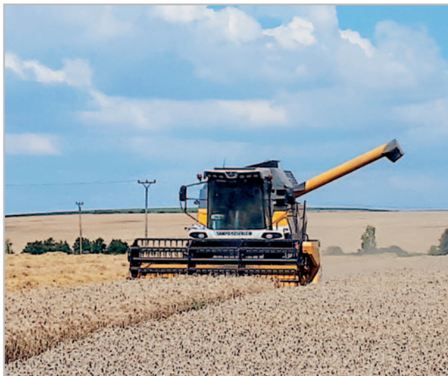
Sklizeň odrůdových pokusů – Přeštica 25. 7. 2018

Viriato je jasnou jedničkou mezi osinatými a svou raností se může zařadit do osevních postupů jako předplodina i pro ozimou řepku. Vyniká výtečnou potravinářskou kvalitou E/A. Zrno je krásně buclaté s vysokou HTZ. Druhou, o trochu pozdnější osinatou pšenici je RGT Sacramento, které patří svou jakostí někde mezi B a C odrůdy. Je to velmi intenzivní odrůda, a tudíž běžně při sklizni dosáhnete potravinář-